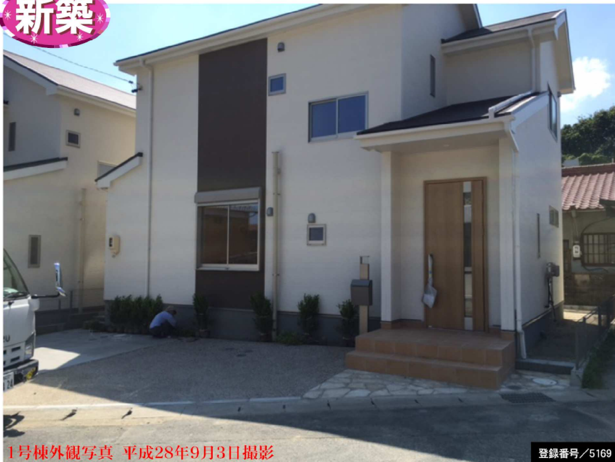
1号棟外観写真 平成28年9月3日撮影

宮前町新築分譲! 1号棟 販売価格(税込) 2,330万円 150万円値下げしました! 2号棟 販売価格(税込) 2,280万円 150万円値下げしました!